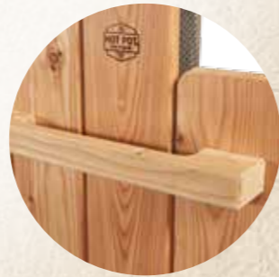
Haltegriff für sicheres Ein- und Aussteigen