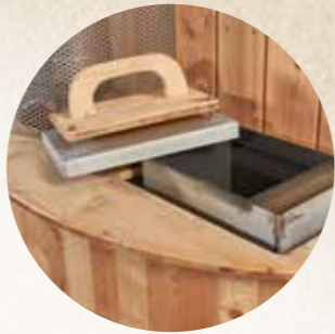
Ofenabdeckung mit Holzgriff